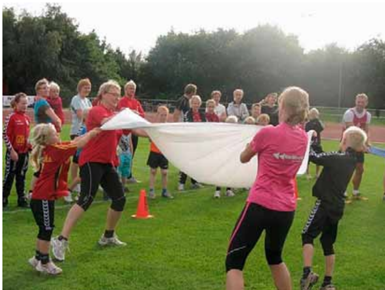
Billedet er fra ”Familieolympiaden”, hvor klubbens børnefamilier dystede i bl.a. vandballonskast!

løbere er altid villige til at give gode råd og opmuntring til de ”nye” løbere der kommer til. Mange kommer til træning lige så meget for at grine som løbe! Alle disse grupper samles hver vinter til den traditionsrige crossturnering, hvor Rødekro-IF Motion i år stiller med 86 medlemmer for at forsøge endnu et år at vinde turneringen. Den 13. november kl. 14.00 var Rødekro vært ved et af sæsonens crossløb, hvor medlemmerne erstattede lørdag eftermiddag foran TV med natur og motion. Så er det, man føler sig som en del af dansk dynamit!