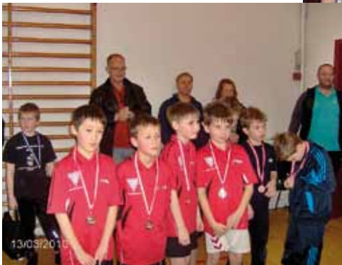
Fredericia yngre drenge B hold (røde trøjer) som fik guld og blev Sønderjyske mestre 2010.