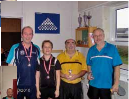
Pokalturneringen i Aabenraa.